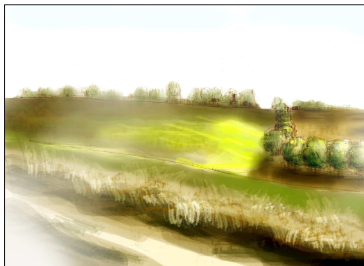
Kresba: Ing. Rastislav Sloboda Návrh na riešenie výsadbou stromov.