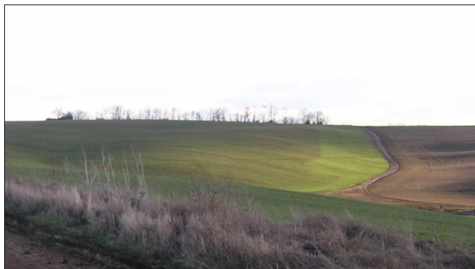
Súčasný obraz krajiny v obci Melek